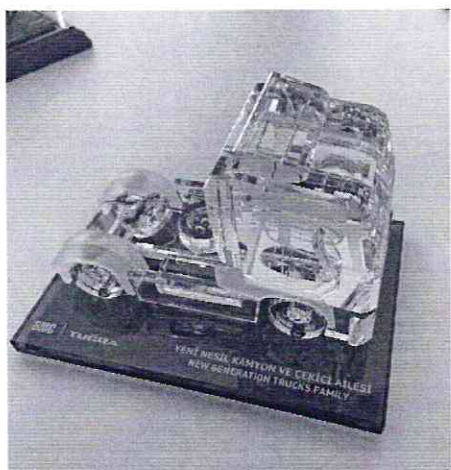
Фото образца (аналог).