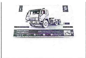
Сборная модель КАМАЗ-54112 седельный тягач