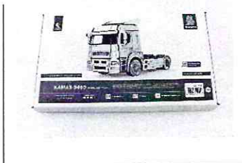
Сборная модель КАМАЗ-5490 седельный тягач