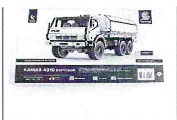
Сборная модель КАМАЗ-4310