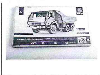
Сборная модель КАМАЗ-5511 Самосвал