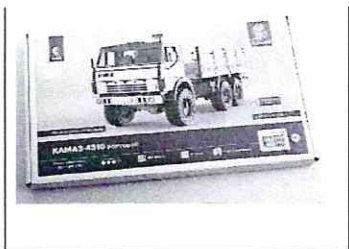
Сборная модель КАМАЗ-4310 Бортовой