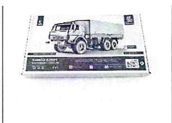
Сборная модель КАМАЗ-53501 бортовой с тентом