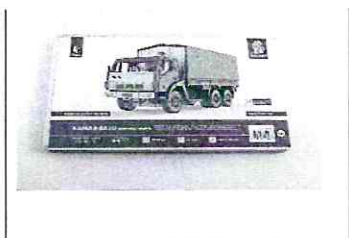
Сборная модель КАМАЗ-5320 бортовой с тентом