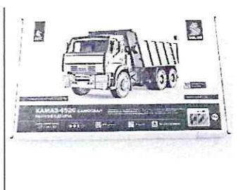
Сборная модель КАМАЗ-6520 самосвал (ранняя кабина)