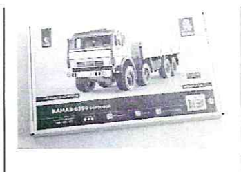
Сборная модель КАМАЗ-6350 Бортовой