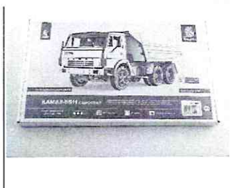
Сборная модель КАМАЗ-5511 Самосвал