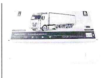
Сборная модель КАМАЗ-54901 с полуприцепом НЕФАЗ-93341