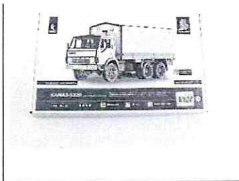
Сборная модель КАМАЗ-5320 бортовой с тентом