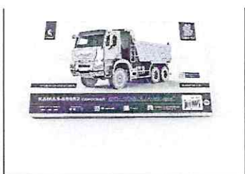
Сборная модель КАМАЗ-65952 самосвал